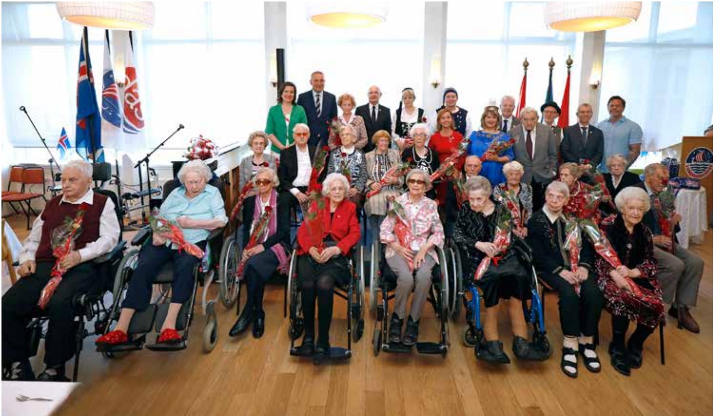
Fullveldisbörnin ásamt forsetahjónunum og fulltrúum Hrafnistu, Sjómannaðagsráðs og fleirum.