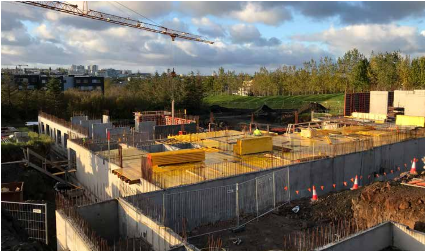
Framkvæmdir við byggingu nýs hjúkrunarheimilis Hrafnistu við Sléttuveg njóta m.a. stuðnings frá DAS.

einustu viku árið um kring og kostar hver dráttur aðeins 375 krónur eða 1500 krónur á mánuði fyrir einfaldan miða og þrjú þúsund krónur fyrir tvöfaldan miða.