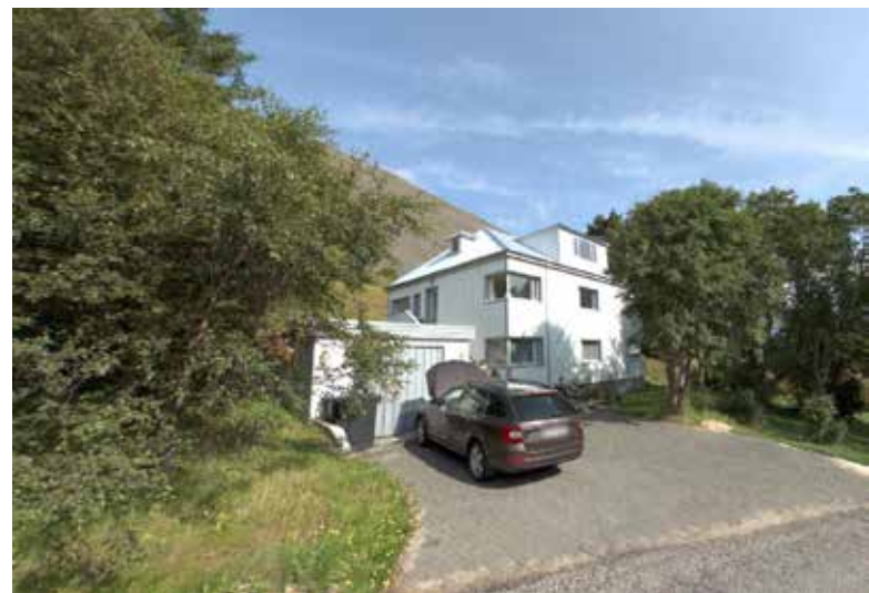
Æskuheimilið við Urðargötu 7 á Patreksfirði.