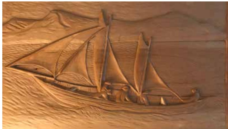
Útskurðarmyndir sem Björn hefur unnið í tré.