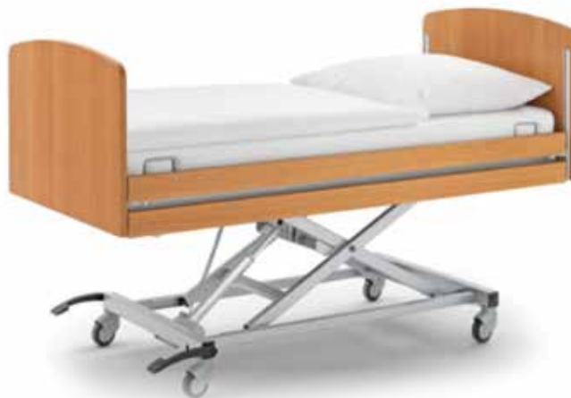
HJÚKRUNARRÚM & SNÚNINGSLÖK