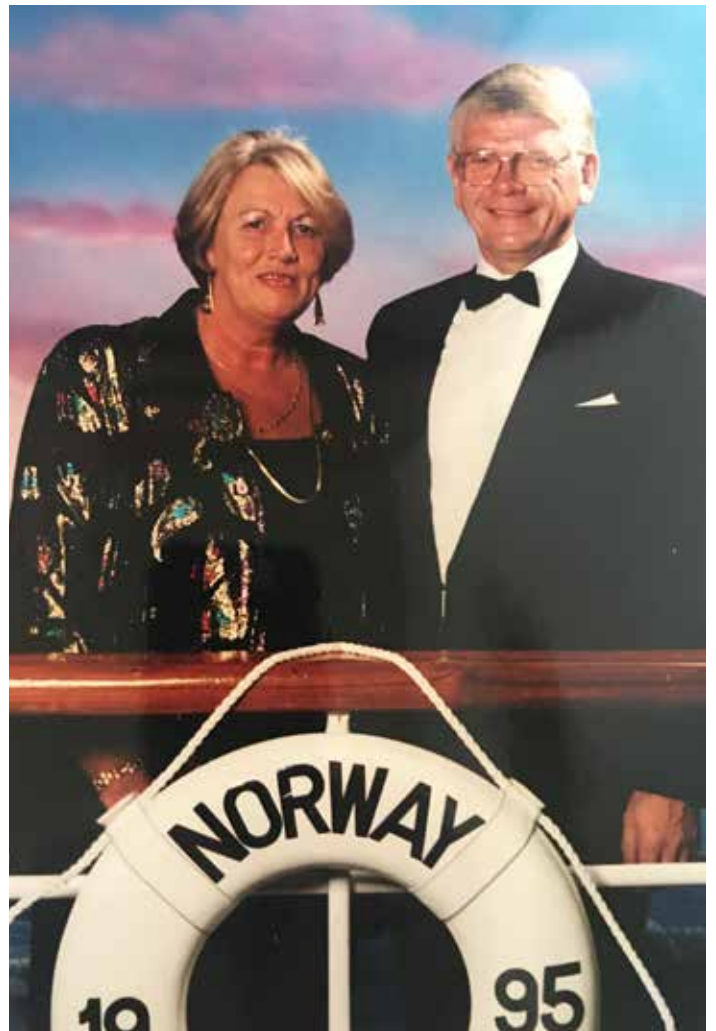
Á siglingu með skemmtiferðaskipinu Norway sumarið 1995.

Árið 1975 hóf Hjalti Páll störf hjá Fjölbrautaskóla Breiðholti, sem þá var nýtekinn til starfa. Þar var Hjalta falið það verkefni að