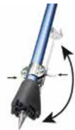
STAFIR OG HÆKJUR

Síðumúli 16 | 108 Reykjavík | Sími 580 3900 | fastus.is