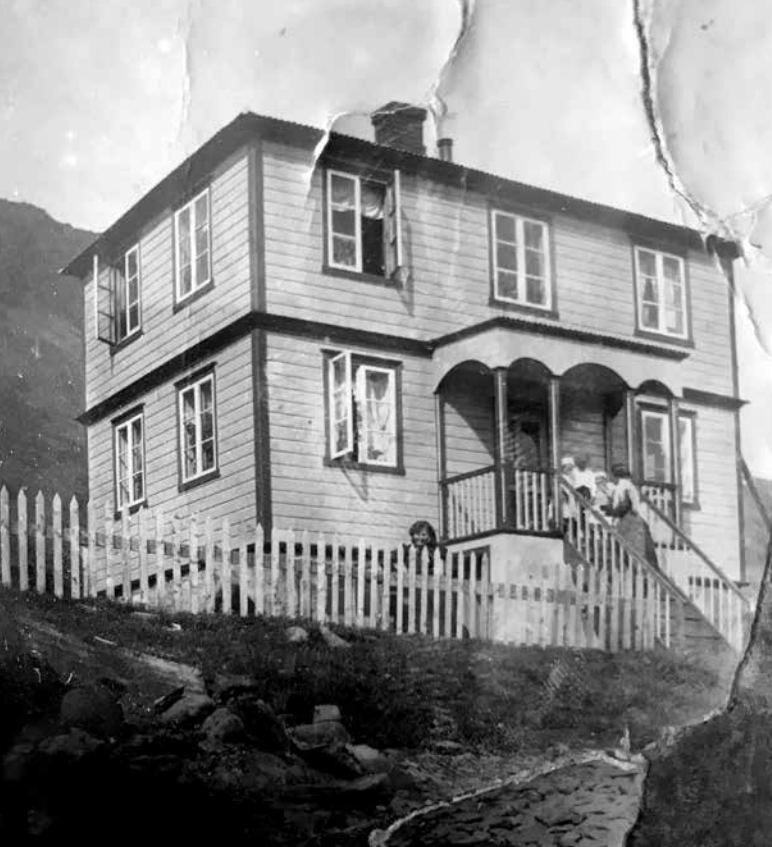
Æskuheimili Hjalta Páls í Súðavík