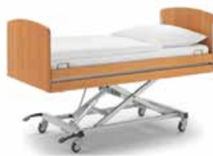
HJÚKRUNARRÚM OG SNÚNINGSLÖK