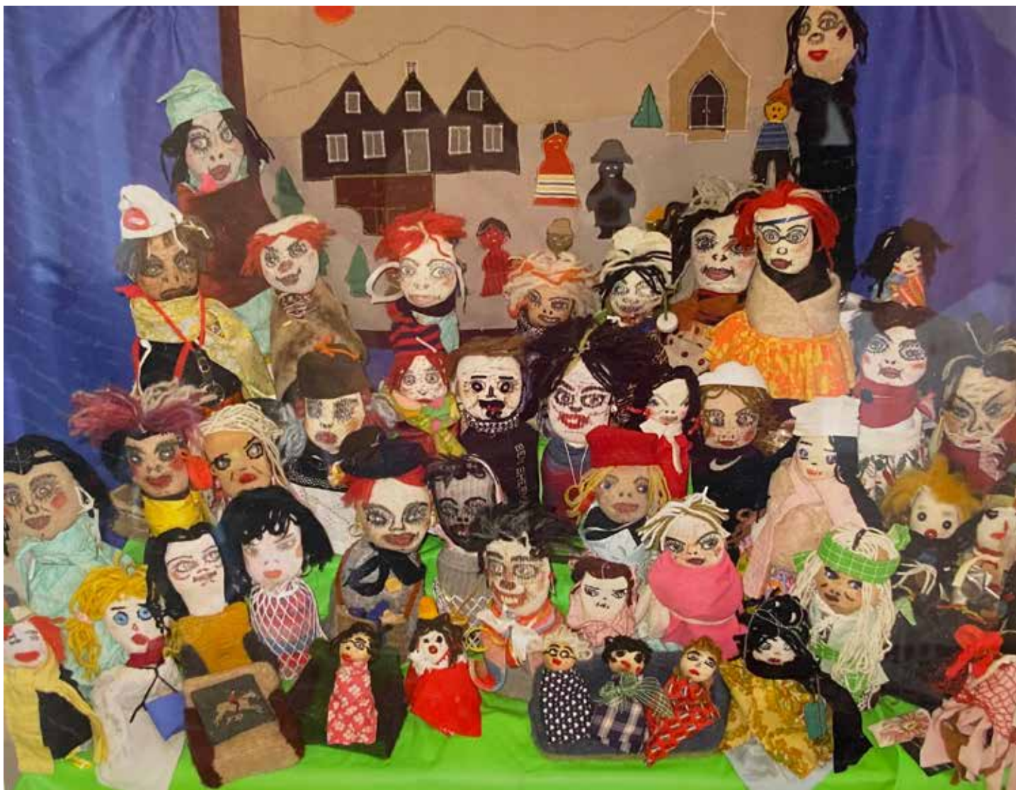
Ruslurnar eru búnar til úr öllu mögulegu „rusli“.