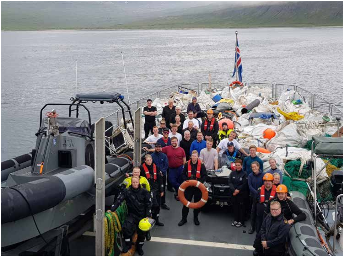
Um borð í varðskipinu Tý að loknu hreinsunarstarfi á Hornströndum sumarið 2019.

var vægast sagt ekki í tísku á þessum árum. Fínast þótti að vera viðskiptafræðingur og vinna í banka. Fólk talaði jafnvel um sjómenn sem deyjandi stétt. En haustið 2007 innritaðist ég í Stýrimannaskólann engu að síður. Námsframvindan var þó nokkuð sundurslitin því mér buðust trekk í trekk góð pláss á togurum svo að ég varð að stunda námið samhliða sjómenskunni. Ég var t.d. allt árið 2008 á Guðmundi í Nesi RE-13 og sumarið eftir steig ég fyrstu stýrimannssporin á Sólbaki EA-301. Ég starfaði einnig sem sölustjóri hjá Iceland Seafood meðfram námi. Fjarnámið var því nokkuð fyrirferðarmikið og því útskrifaðist ég ekki fyrr en vorið 2014 og þá með ótakmörkuð skipstjórnarréttindi," segir Aríel.