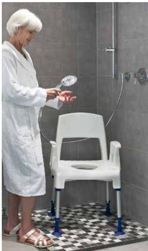
Hjálpartæki á baðherbergi