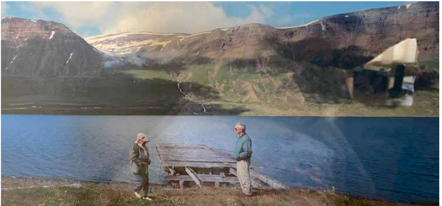
Hjónin ferðuðust víða um landið í fríum sínum.