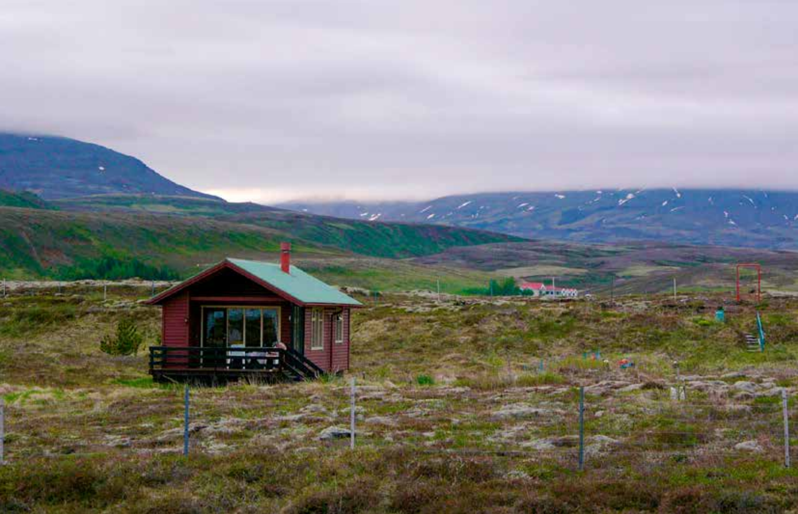
Sumarbústaður fjölskyldunnar í Kárastaðalandi.